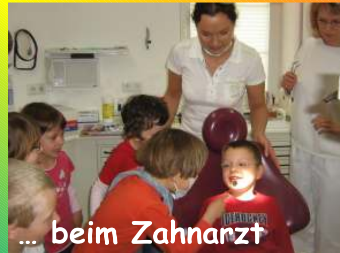
... beim Zahnarzt