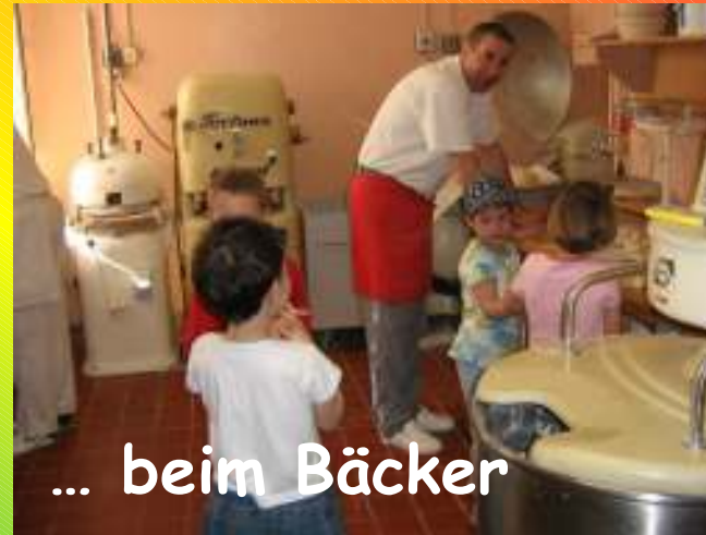
... beim Bäcker