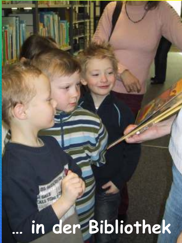
... in der Bibliothek